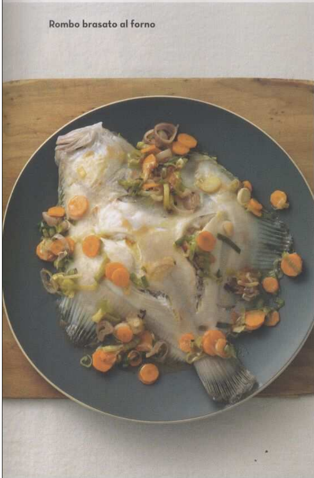
Rombo brasato al forno