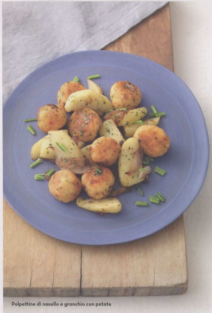
Polpettine di nasello e granchio con patate

Acqua piatta, oligominerale, di gusto delicato e fine